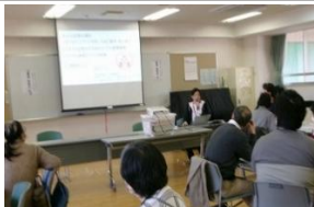
裏面は市民図書室 ☐ です